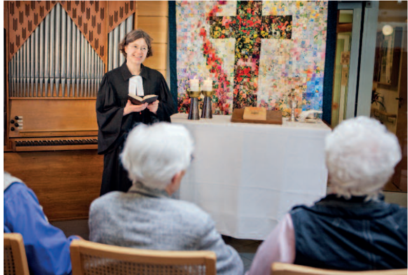
Sorge für die Seele

In Zusammenarbeit mit der evangelischen und katholischen Gemeinde finden regelmäßig Andachten, Gottesdienste und Abendmahlsfeiern statt, zu denen Bewohner, Angehörige und Gäste herzlich eingeladen sind. Für Menschen mit Demenz bieten wir besonders gestaltete Gottesdienste an.