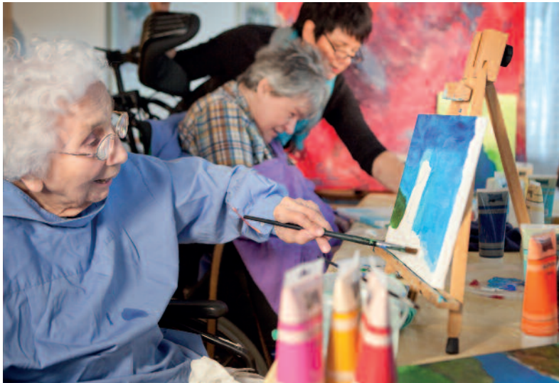
Alter ist bunt: gemeinsam neue Talente entdecken

Für Menschen mit einem hohen Betreuungsbedarf oder Bewohner, die ihr Zimmer nicht mehr verlassen, gibt es zusätzliche individuelle Beschäftigungsangebote.