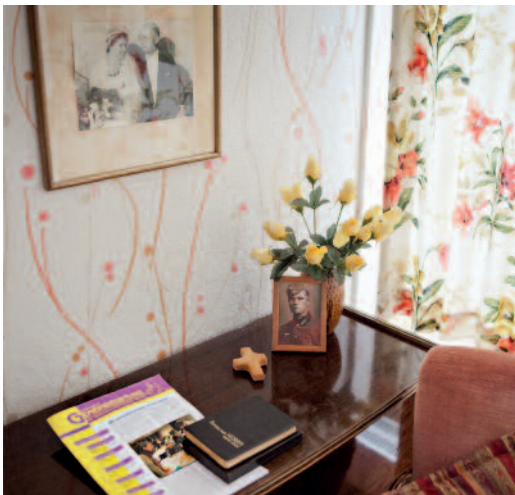
Erinnerungen lebendig halten

Für die mit dem Heimeinzug verbundenen Veränderungen aus dem Blickwinkel der Angehörigen bietet unser Sozialdienst einen regelmäßigen Gesprächskreis an, zu dem alle herzlich eingeladen sind.