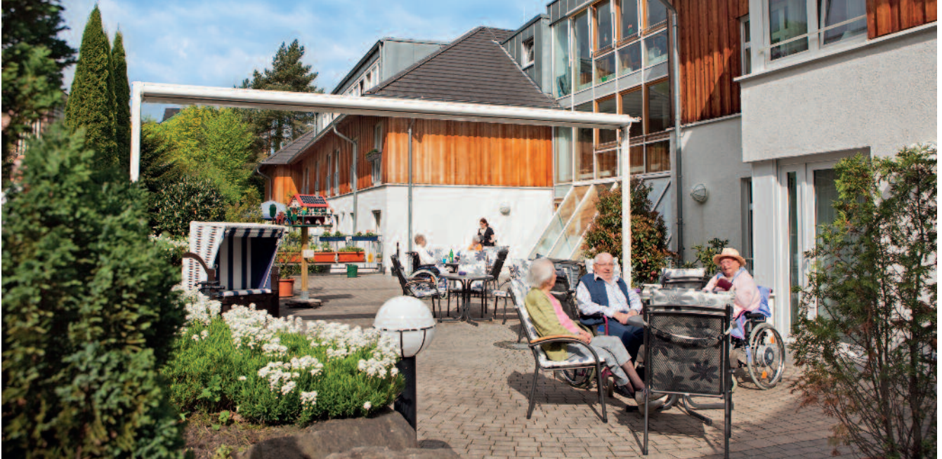
Das Tersteegen-Haus – ein Ort der Geborgenheit

Unterhalb des Iserlohner Fröndenberg, mit Blick auf Altstadt und Bauernkirche, befindet sich das 1957 gegründete Altenzentrum Tersteegen-Haus. Zum Haus gehören auch seniorengerecht gestaltete Wohnungen direkt in der Nachbarschaft.