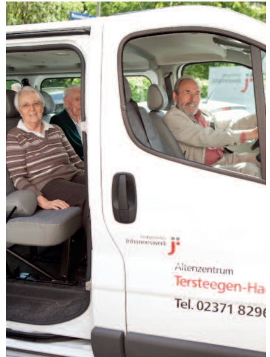
Eine Fahrt ins Blaue sorgt für lebhaftere Eindrücke

Der Einzug in ein Alten- und Pflegeheim fällt den meisten Menschen nicht leicht und ist häufig von einem schwierigen Entscheidungsprozess begleitet. Der Sozialdienst bietet Beratungsgespräche zum Einzug an und informiert über Voraussetzungen zur Aufnahme, Leistungen der Einrichtung und die Finanzierung. Bei dieser Gelegenheit kann unsere Einrichtung auch besichtigt werden. Gerne schicken wir Ihnen vorab Informationsmaterial zu. Die Kosten für eine vollstationäre Pflege oder für eine Kurzzeitpflege richten sich nach der jeweiligen Pflegestufe des Bewohners. Die aktuellen Pflegesätze für das Tersteegen-Haus entnehmen Sie dem beigefügten Informationsblatt.