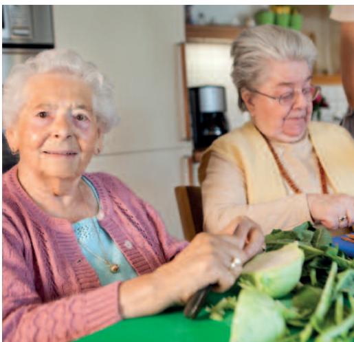
Jeder kann sich einbringen, wo er möchte