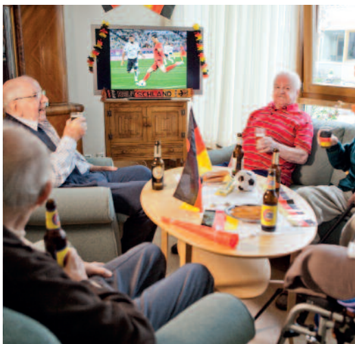
Heute ist Männerabend!

Unsere Cafeteria, der zentrale Treffpunkt in der Eingangshalle, ist viermal wöchentlich für Bewohner und Besucher geöffnet. Engagierte Ehrenamtliche bewirten die Gäste und leisten ihnen Gesellschaft.