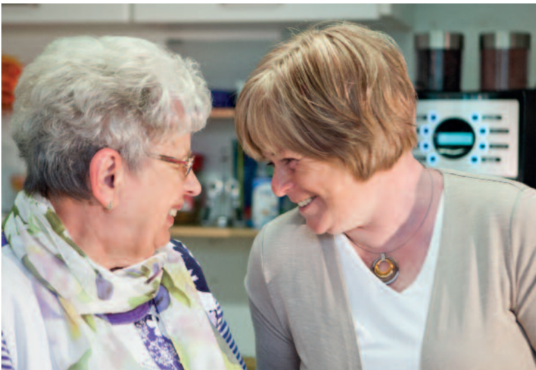
Gemeinsames Engagement – mit Freude beim Ehrenamt

Sprechen Sie uns an, wir beraten Sie gerne in einem persönlichen Gespräch.